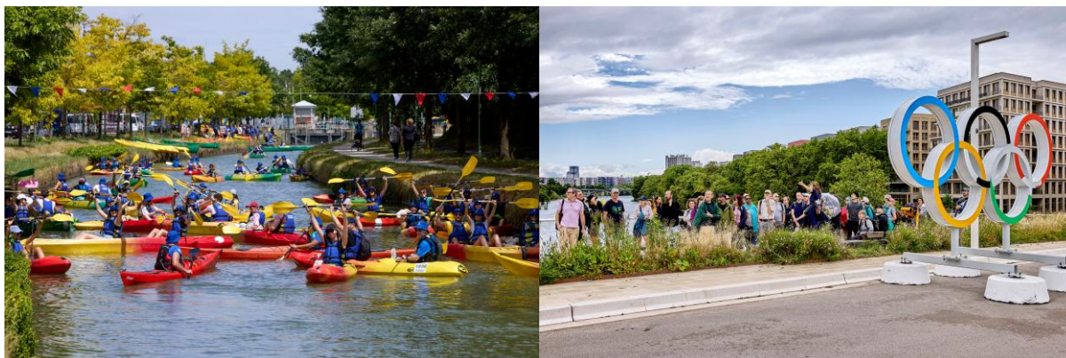
De gauche à droite : Canal en pagaies et la Grande marche Héritage olympique

Du 27 juin au 9 août 2026 , l'événement estival emblématique qui anime les canaux parisiens et la Seine revient avec ses activités incontournables : navettes fluviales, croisières thématiques, ateliers et balades. Mais ce n'est pas tout !