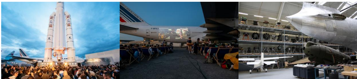
De gauche à droite : Cercle Festival, Ciné Tarmac et les ateliers de restauration des avions du Bourget

Cercle Festival en mai, Ciné Tarmac en juillet, la visite des ateliers de restauration des avions lors des Journées européennes des Métiers d'art en avril : le Musée de l'Air et de l'Espace au Bourget multiplie les rendez-vous pour faire vivre au grand public des expériences immersives uniques sur le tarmac du premier aéroport d'affaires européens .