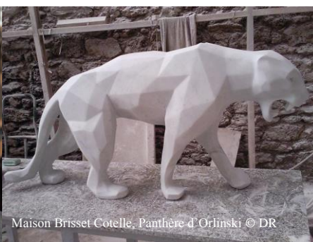
Maison Brisset Cotelle. Panthère d'Orlinski