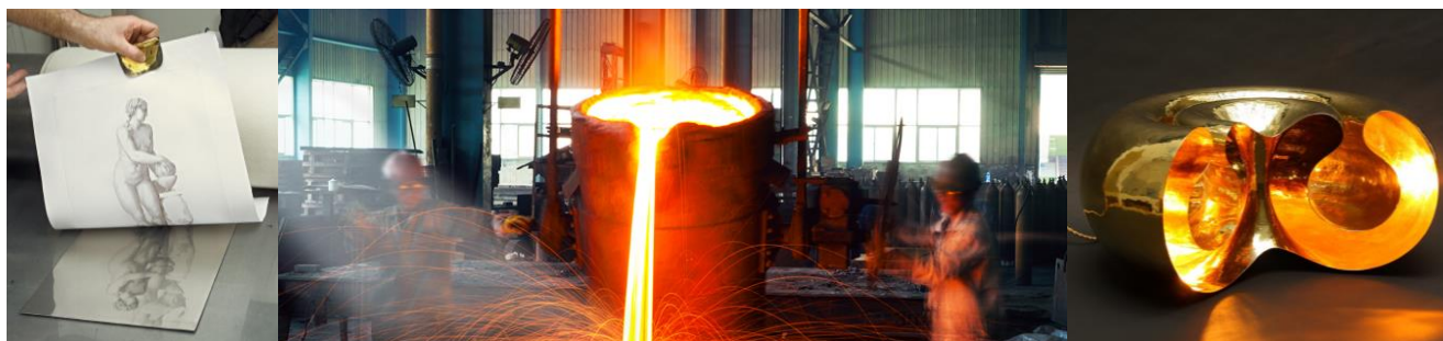
Atelier Chalcographie RMN © RMN / Fonderie d'Art Chapon © DR / Nathanael Le Berre, création originale © DR