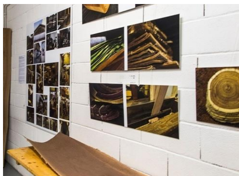
Exposition Le Bois en majesté