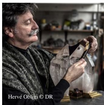
Hervé Obligi © DR

Exemples d'artisans implantés dans le Nord-Est Parisien