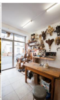
Atelier Alaric Chagnard