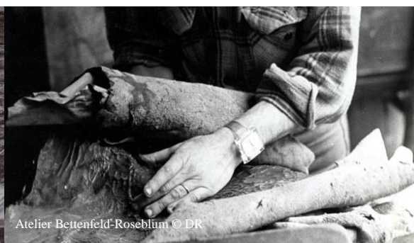
Atelier Bettenfeld-Roseblum

Rendez-vous sur le site internet pour plus d'informations et voir toutes les visites